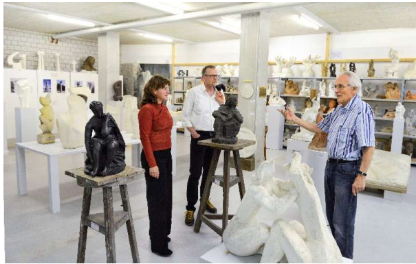
Sammlung Lipsi, Hinwil