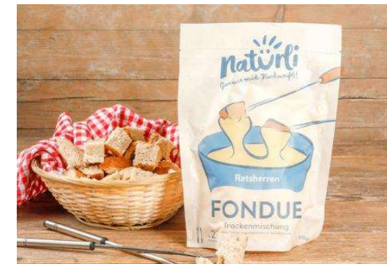
Produkte der natürli zürioberland ag, Saland