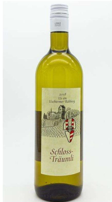
Wein von Heusser Rebbau, Uster