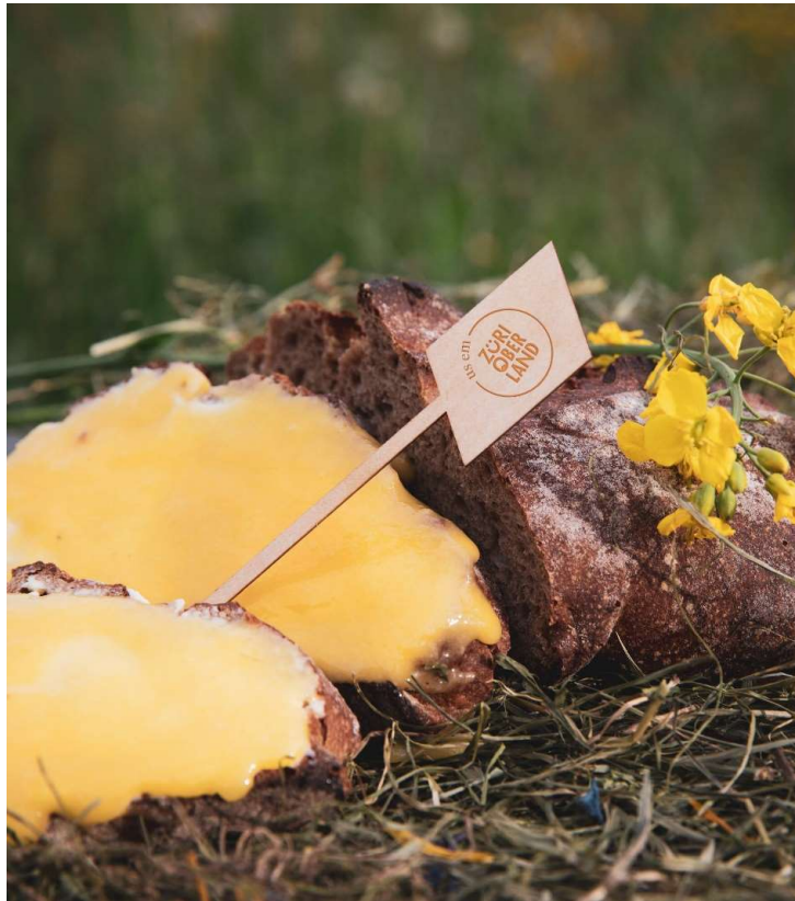
500 echte Regionalprodukte von 30 Produzent:innen