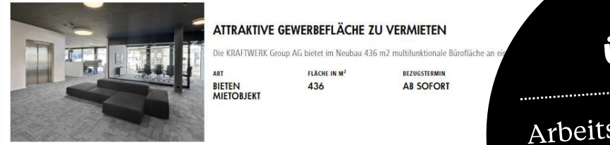
Plattform für Gewerbeimmobilien und Bauland auf zuerieroberland.ch

ÜBER 20 Arbeitsplatzgebiete von regionaler und überkommunaler Bedeutung