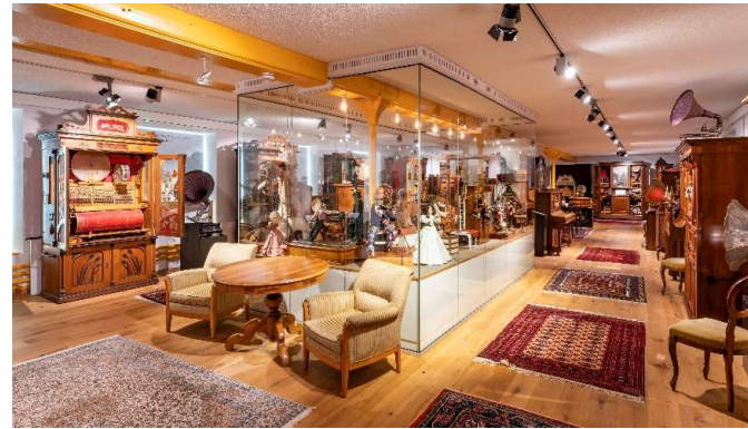
KMM Kulturzentrum, Dürnten