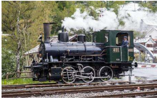
Dampfbahnverein Zürcher Oberland