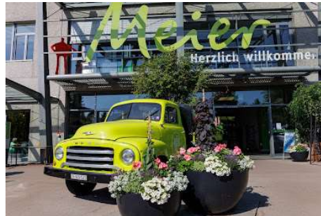
Gartencenter Meier, Dürnten