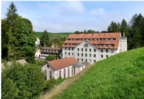
Museum Neuthal, Bäretswil