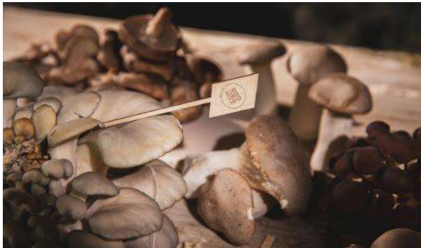
Pilze von Fine Funghi, Gossau ZH