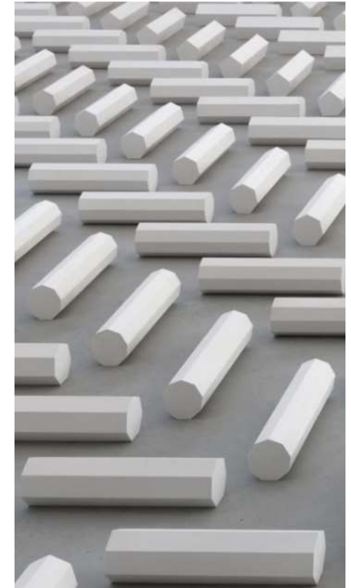
The 2000 Sculpture, Uster