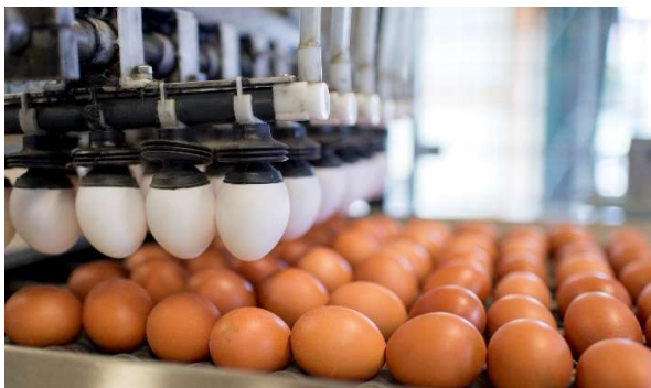
Eier der Hosberg AG, Rüti