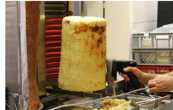
Cheebab der Wildbergkäserei, Wildberg